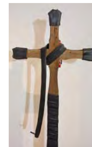
Doppelkreuz mit Auto, 140 x 50 x 12