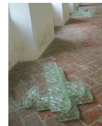
Doppelkreuz + gefallen