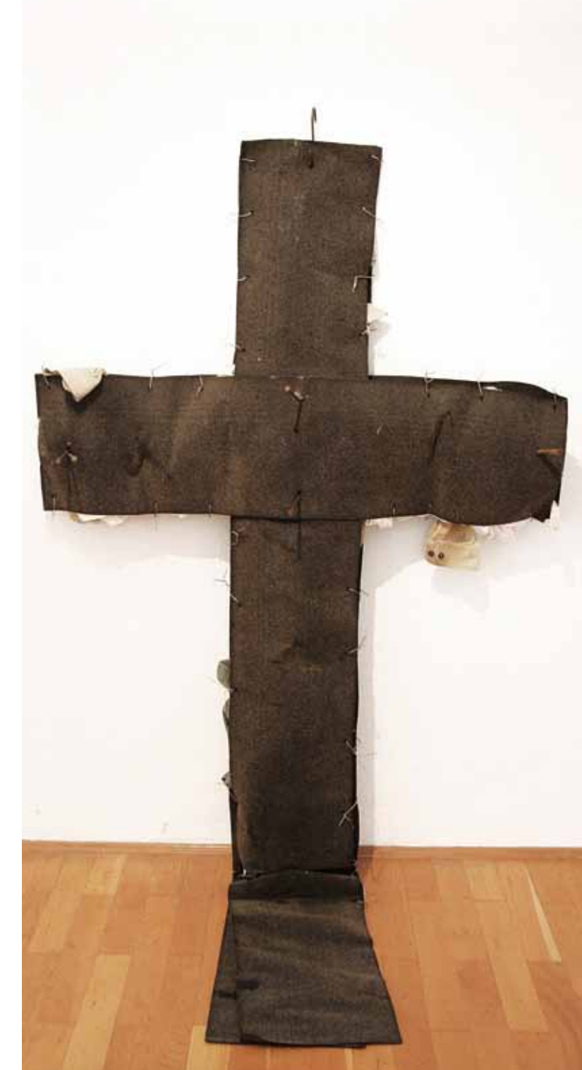
crux in die Knie gegangen, 230 x 120 x 15