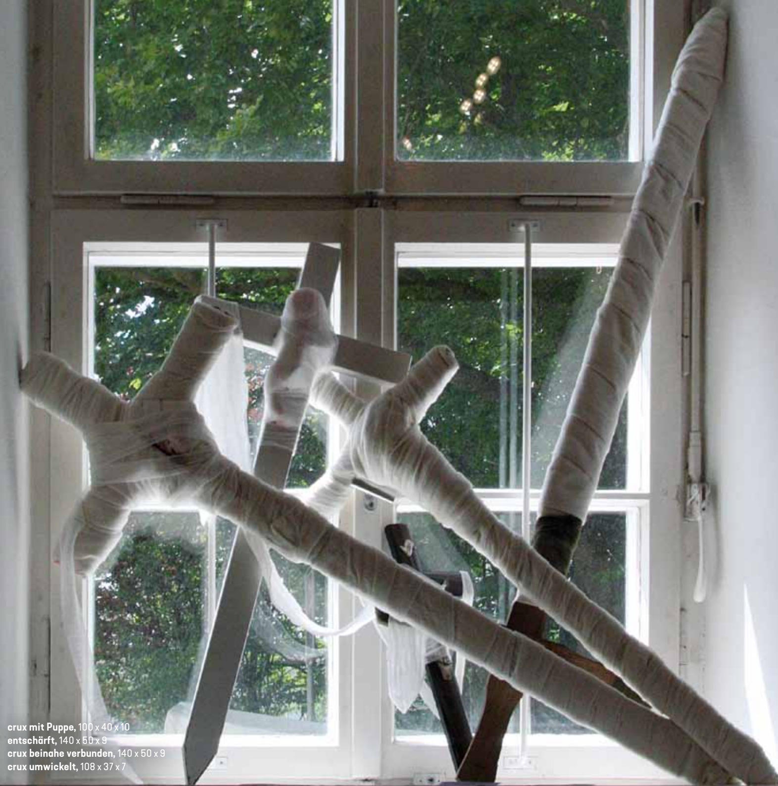
crux mit Puppe, 100 x 40 x 10 entschärft, 140 x 50 x 9 crux beinahe verbunden, 140 x 50 x 9 crux umwickelt, 108 x 37 x 7