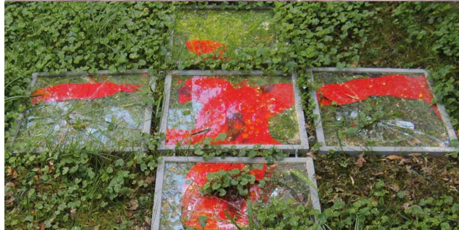
Fensterkreuz und Kinderspiel, 184 x 135 x 3, ausgestellt und zerstört im Kunstfrühling Bad Wörishofen