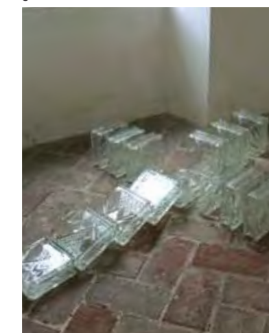
gefallen, 140 x 120 x 20