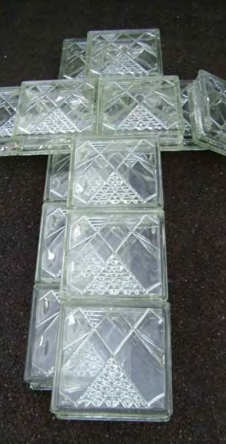
Doppelkreuz, 132 x 113 x 20