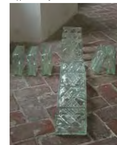
gefallen, 140 x 120 x 20